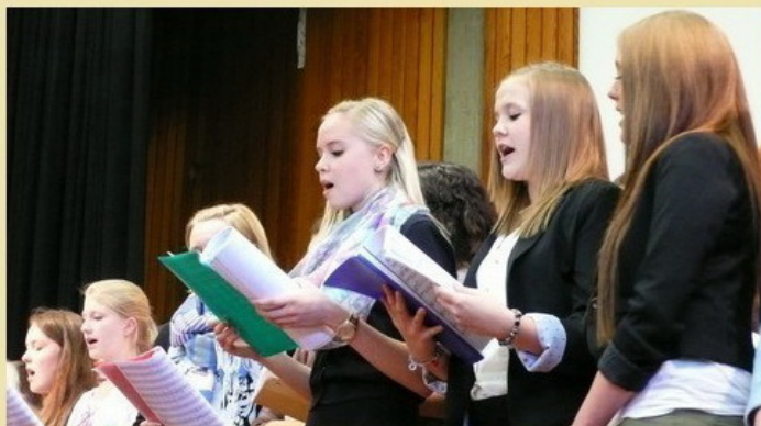
Der MUP-Kurs der Jgst. 11 sang u.a. Wonderwall , Fame , Turning Tables , Mad World , I will follow him und Barbara Ann .