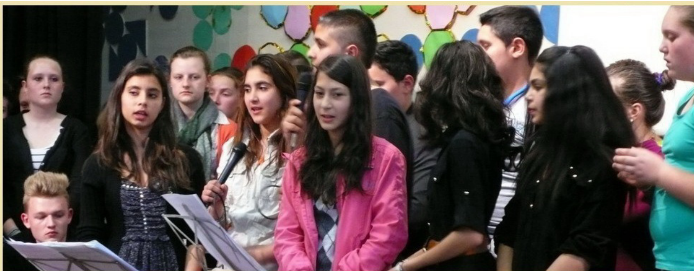
Schülerinnen und Schüler unserer Integrationsklassen singen das bulgarische Lied Valschebni Dumi .