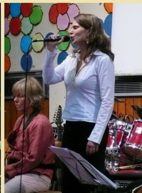
Frau Sosa singt (und wünscht sich): Summertime